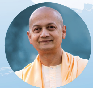
Swami Sarvapriyananda USA